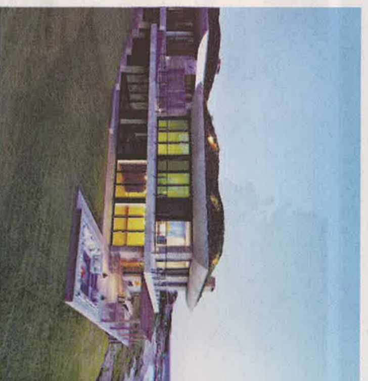
PLAYA VIK: Denne avertgårde-resorten åpnet i sommer og består av ni luksuss-suiter i havgappet.